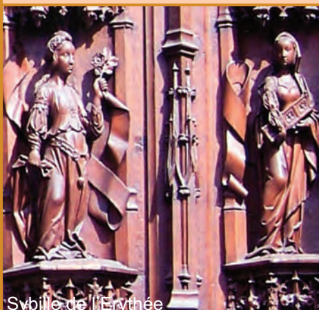
Sybille de l'Erythée